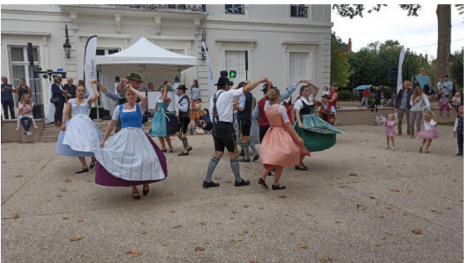
Schuhplattler und Tanz