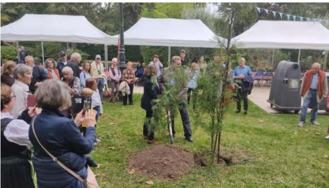
Pflanzen eines Partnerschaftsbaum am Rathaus (Mimose)