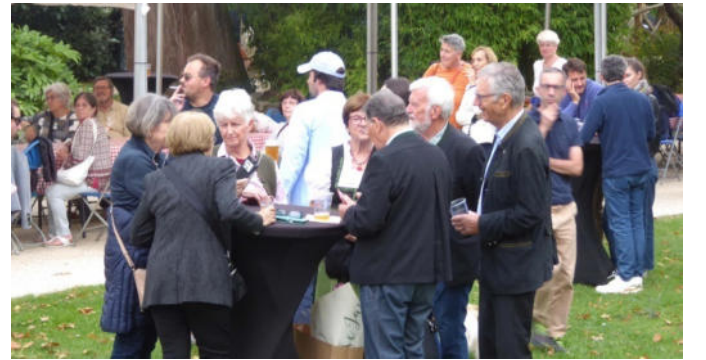
Bayrisches Fest vor dem Rathaus