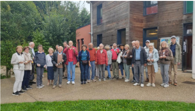
Boule Turnier Siegerehrung