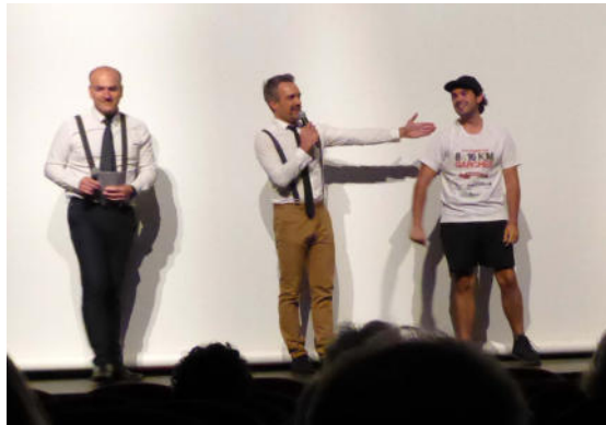
Komödianten aus Garches