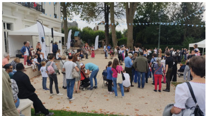
Tanzfläche vor dem Rathaus