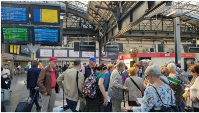
eine von 5 besichtigten Passagen in Paris