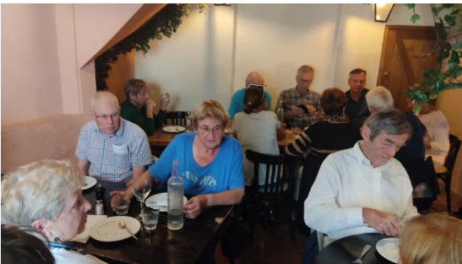
Mittagessen in Paris