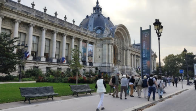
Petit Palais in Paris