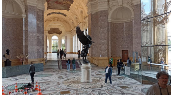
Museum, Petit Palais in Paris