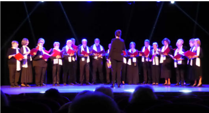
gemischter Chor aus Garches