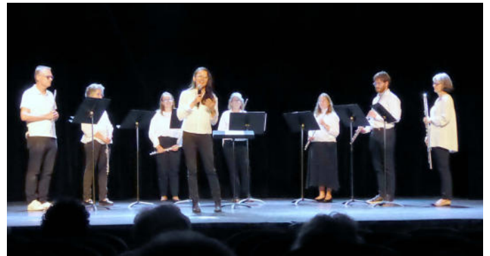
Flötengruppe aus Garches