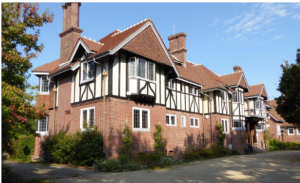
Gruppe, Besichtigung Villen in Garches